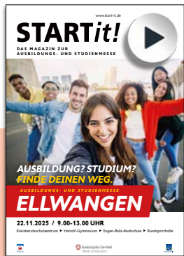
Titel Ellwangen 2025

Anzeigenschluss für ... klassische Anzeigen und Azubivorstellungen: Montag, 27. Juli 2026