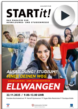
Titel Ellwangen 2025

Anzeigenschluss für ... klassische Anzeigen und Azubivorstellungen: Montag, 27. Juli 2026